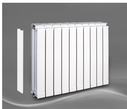
Vanessa 600 + Seitenabdeckung