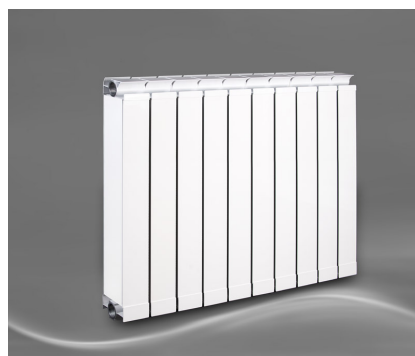
Vanessa 600 + Seitenabdeckung