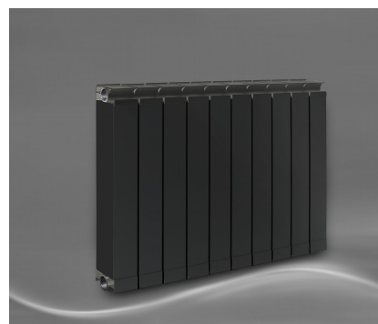
Vanessa 550 AZ + Seitenabdeckung