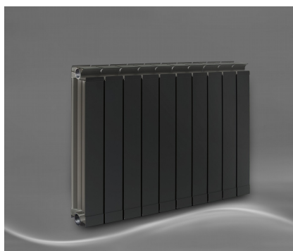
Vanessa 550 AZ