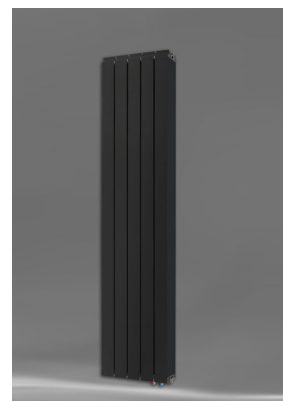
Vanessa 1800 AZ + Seitenabdeckung