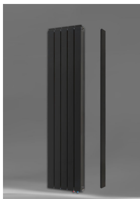
Vanessa 1800 AZ + Seitenabdeckung