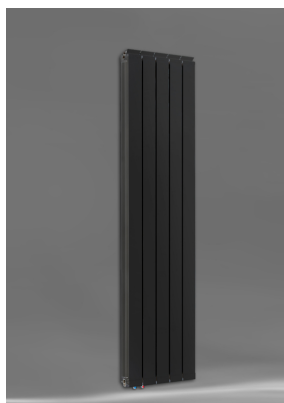
Vanessa 1800 AZ