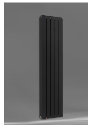
Vanessa 1800 AZ + Seitenabdeckung