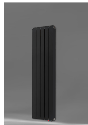
Vanessa 1600 AZ + Seitenabdeckung