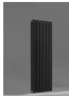
Vanessa 1600 AZ + Seitenabdeckung