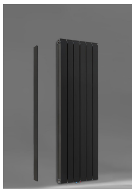
Vanessa 1600 AZ + Seitenabdeckung