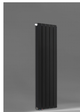
Vanessa 1600 AZ + Seitenabdeckung