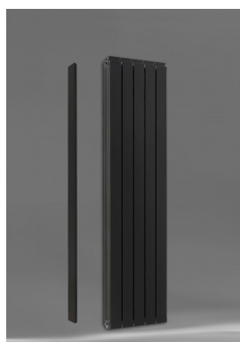
Vanessa 1600 AZ + Seitenabdeckung