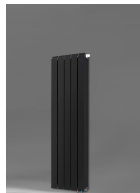
Vanessa 1400 AZ + Seitenabdeckung