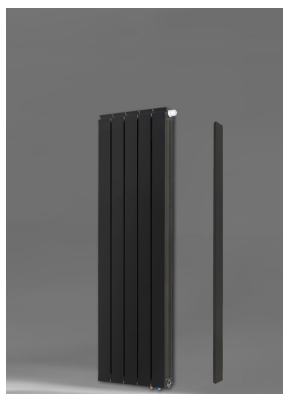
Vanessa 1400 AZ + Seitenabdeckung