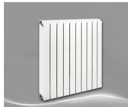
Max 800 + Seitenabdeckung