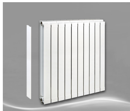
Max 800 + Seitenabdeckung