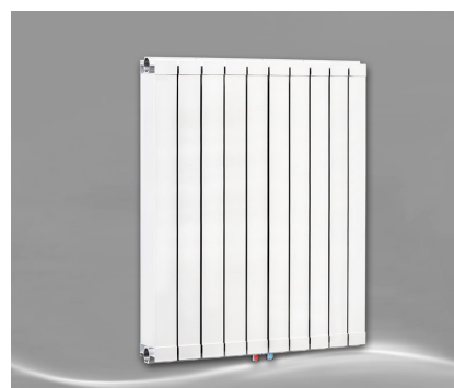
Max 1000 + Seitenabdeckung