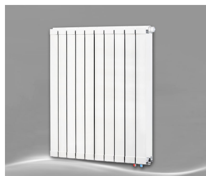
Max 1000 + Seitenabdeckung