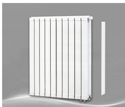
Max 1000 + Seitenabdeckung