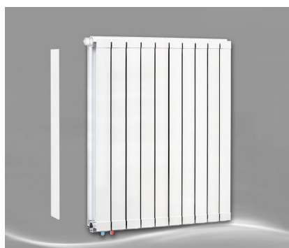
Max 1000 + Seitenabdeckung