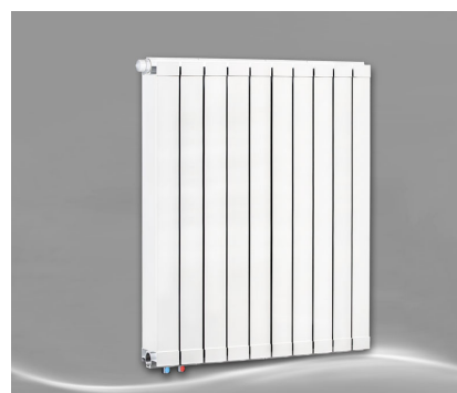
Max 1000 + Seitenabdeckung