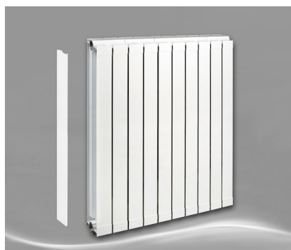
Max 1000 + Seitenabdeckung