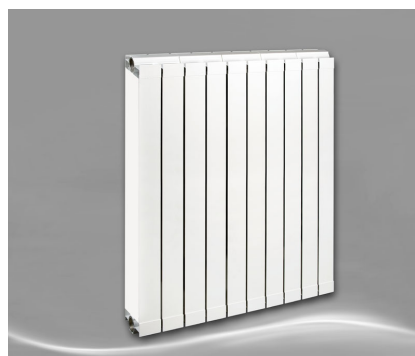
Max 1000 + Seitenabdeckung